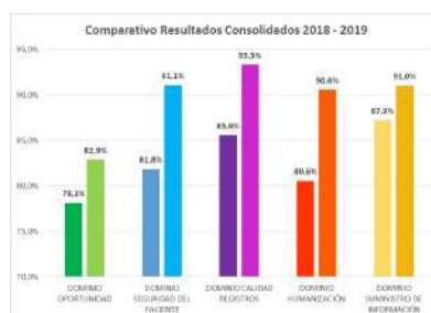
Gráfico 2. Resultados por dominio paciente trazador OCBP comparativo 2018 - 2019.

Por cada dominio se observa un importante mejoramiento entre los resultados obtenidos en el año 2018 y año 2019.