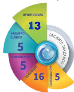
Gráfico 1. Dominios y variables que componen la herramienta paciente trazador institucional.

A cada variable se le asignaron criterios de cumplimiento que permiten establecer su resultado en escala liker de 1 a 5. Para disminuir el sesgo del encuestador se realizó entrenamiento, replicado a cada colaborador que se le asigna la función. A modo de ejemplo se presenta la variable "evaluación periódica y sistemática del dolor" del instrumento: