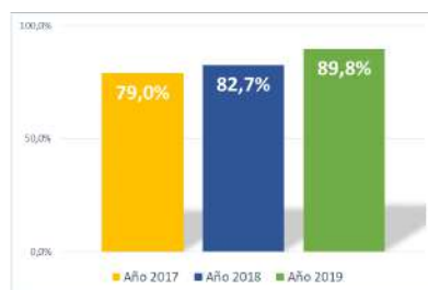
Gráfico 3. Resultado consolidado paciente trazador OCBP.

Por cada dominio se observa un importante mejoramiento entre los resultados obtenidos en el año 2018 y año 2019.