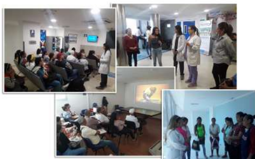
Imagen 2: Grupo de apoyo para cuidadores de pacientes oncológicos.

Se escoge la utilización de la escala FACT-G y con base en sus instructivos, se implementa el instrumento luego de capacitación al equipo y definición de procedimiento institucional para su uso.