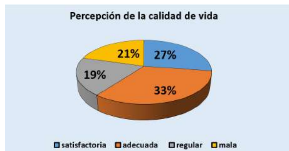
Gráfica 1: Resultados FACT-G: Percepción calidad de vida global.