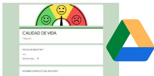
Imagen 1. Instrumento institucional para consolidar resultados FACT-G

La calificación del FACT-G se efectúa según el manual de uso suministrado por la organización FACIT.org al otorgar licencia para su uso sin modificación de su contenido y por medio de un instrumento institucional (Google Drive), se consolida la información para el análisis de los resultados.